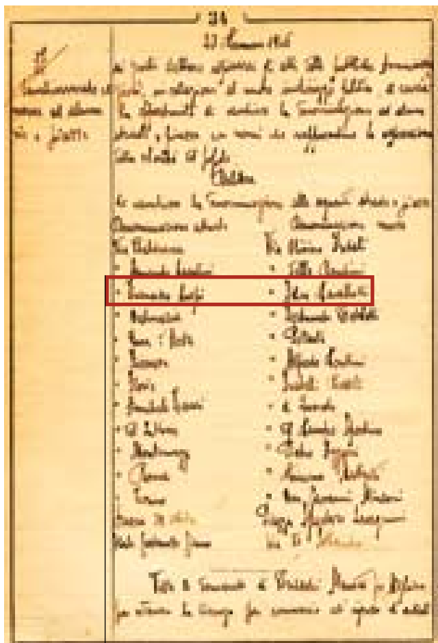
La delibera della Giunta Municipale di Sesto Fiorentino del 20 gennaio 1945 con cui si modificavano i nomi delle vie dopo il ventennio fascista e si riportava quello della "Strada Nova" da Via Crispi a Via Cavallotti

Il duello in cui Cavallotti trovò la fine dei propri giorni fu provocato da un diverbio con il conte Ferruccio Macola, direttore del foglio conservatore "Gazzetta di Venezia", tacciato di "mentitore" da parte di Cavallotti, a seguito della pubblicazione di una notizia non verificata relativa ad una querela da questi ricevuta in qualità di deputato. L'ultimo duello, che mise fine all'esistenza irrequieta e tempestosa di Felice Cavallotti, ebbe luogo il 6 marzo 1898 a Roma, presso la Porta Maggiore, nella villa della contessa Cellere. Trafitto alla bocca e alla carotide dal Macola, Cavallotti si spense